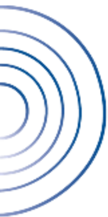
Fig. 11. Niveles relativos de habilidades sociales